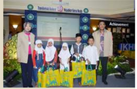
Pemberian santunan Anak Yatim dalam acara HUT KIEC Ke - 34