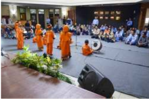
Pembukaan HUT KIEC dengan marwis SD Juara Cilegon