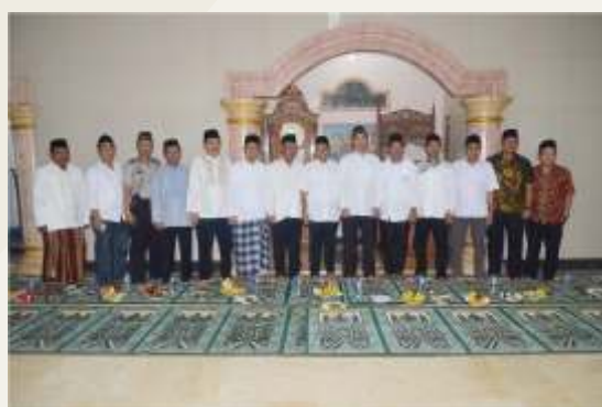
Tarawih Kunjungan di mesjid jami AT – Taqwa Taman sari Merak dan Pemberian Bantuan dana dari PT. KIEC