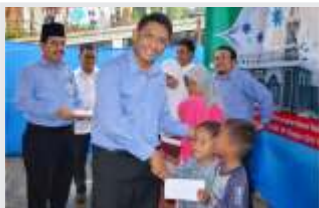
PELETAKAN BATU PERTAMA MASJID RAYA RAKATA

“Sucikan Hati, IKHLAS kan Diri, Perkuat Tali Silaturahmi”