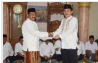
KIEC TARAWIH BERKUNJUNG BERSAMA MUSPIDA CILEGON