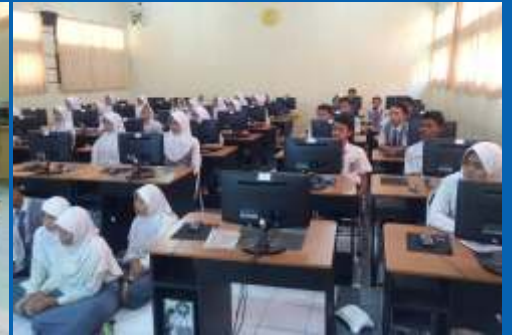
Foto bersama dilakukan setelah usai acara, dan sekitar 50 siswa siswi yang turut hadir dalam acara ini, dan berharap acara ini terus berkelanjutan sehingga siswa/i yang belum mengikuti acara ini dapat terakomodir.

kepada peserta, sehingga pengajar dapat mendapatkan gambaran jawaban yang mendekati pertanyaan tersebut; Bagaimana bila peralatan tidak lengkap seperti tidak ada Infocus? Bagaimana cara mengatasinya? Bisa diantisipasi oleh pengajar dengan cara komunikasi yang aktif kepada peserta dengan menambahkan informasi-informasi yang berhubungan dengan materi tersebut.