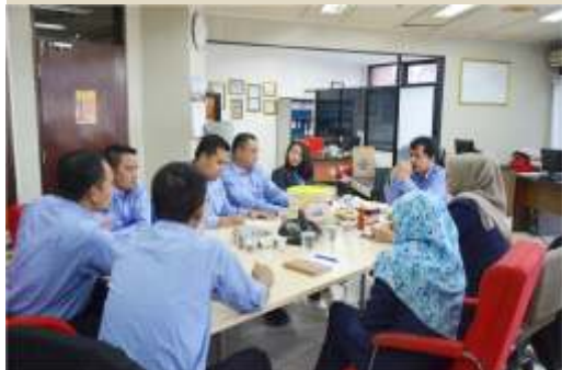
Divisi Corsec rapat persiapan Halal Bihalal