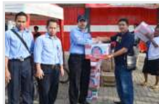
PT. KIEC PEDULI KORBAN BENCANA BANJIR DAN TANAH LONGSOR ANYER