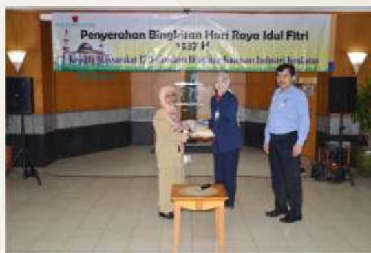
Penyerahan Bingkisan Hari Raya Idul Fitri dari PT. KIEC Kepada Masyarakat 17 Kelurahan di Sekitar Kawasan Industri Krakatau