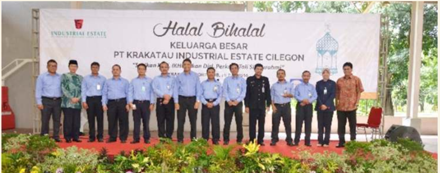
Acara Halal Bi Halal Keluarga Besar PT. KIEC 1437 H di laksanakan pada hari Selasa, 19 Juli 2016 di Gedung Krakatau Sport Club Level PT. KIEC, Jl KH Yasin Beji Cilegon dengan tema "Sucikan Hati, IKHLASkan Diri, Perkuat Tali Silaturahmi".