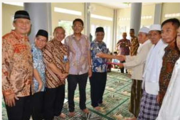
Sholat Jum'at Keliling PT. KIEC dan Pemberian Santunan