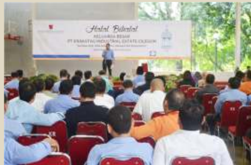
Sambutan President Director PT KIEC dalam Acara Halal Bihalal