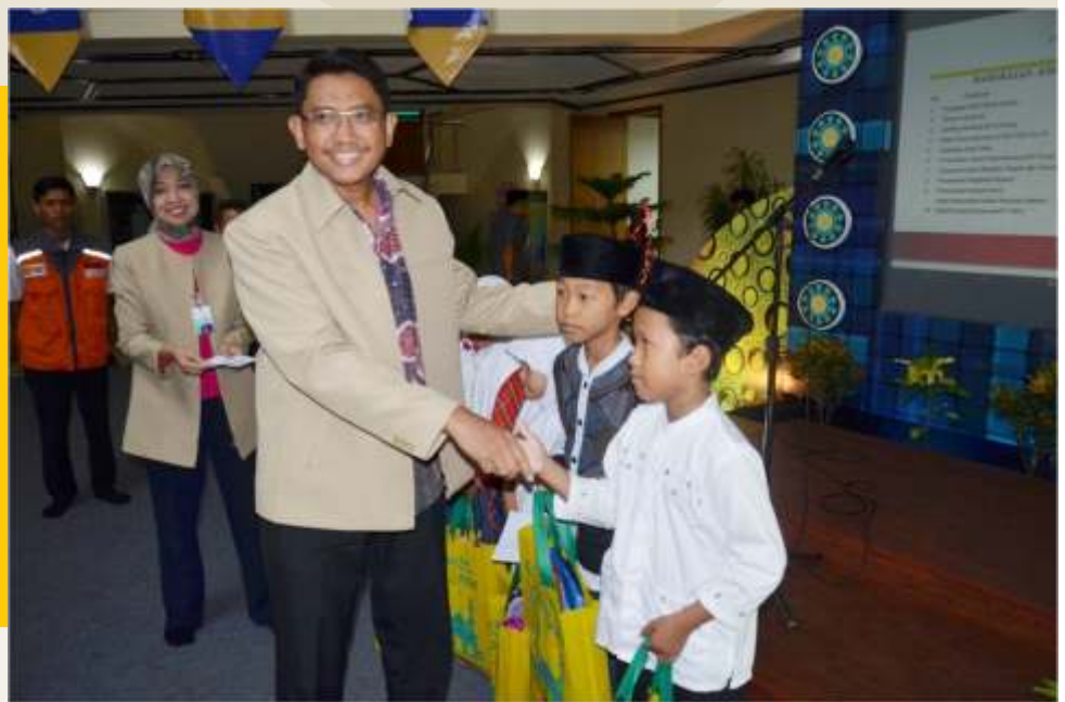
Pemberian santunan Anak Yatim dalam acara HUT KIEC Ke - 34