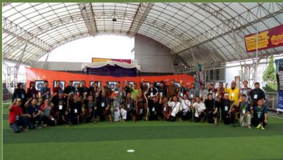
Para peserta lomba kategori horsebow berpose sebelum bertanding

penunggang kuda, walaupun dapat digunakan oleh pejalan kaki, menggunakan teknik thumbdraw atau menarik busur dengan ibu jari. Teknik yang