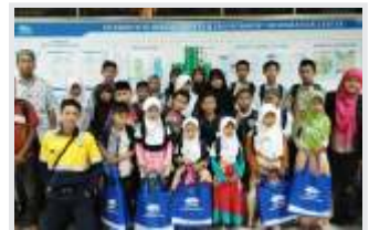
PT NS BLUESCOPE INDONESIA BERIKAN SANTUNAN ANAK-ANAK DHUAFA