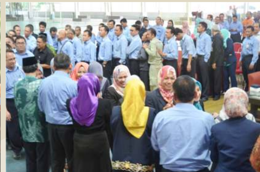
Acara Halal Bihalal KIEC 1437 H