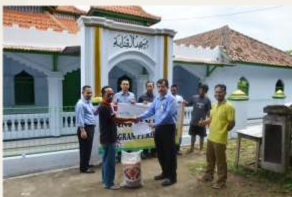
Kegiatan CSR PT KIEC Penyerahan Bantuan Beras di Kawasan Industri 3 Anyer Cilegon